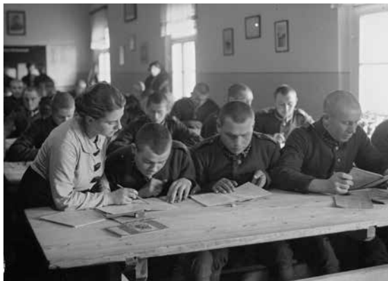
Żołnierze 21. Warszawskiego Pułku Piechoty „Dzieci Warszawy” podczas nauki czytania

Działania przedstawione na fotografii prowadziły do