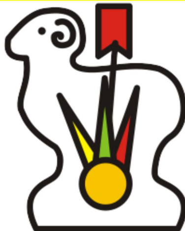
BARANEK Z CUKRU